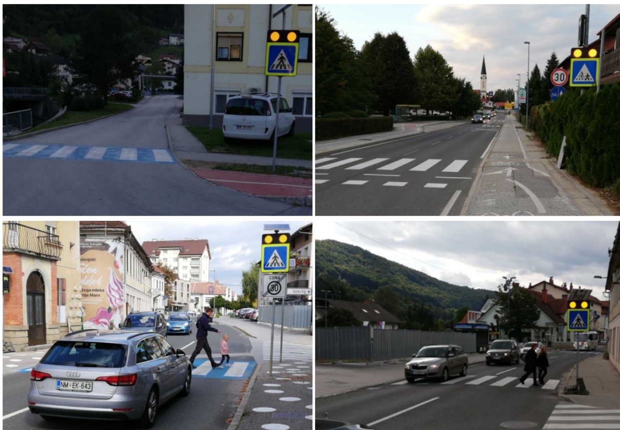
Slika 3: primeri opremljenih prehodov za pešce s sistemom COPS@zebra LITE