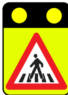
Slika 2: Znak 7205 z vgrajenim stalnim znakom 1115 za prehode za pešce izven naselja

V večini primerov se kot stalni prometni znak uporabi 2431, predvsem v naseljih. Izven naselja se praviloma uporabi znak 1115, ki se postavlja na večji razdalji od prehoda za pešce (150 m do 250 m), da pri praviloma višjih hitrosti prometa voznike pravočasno opozarja na približevanje prehodu.