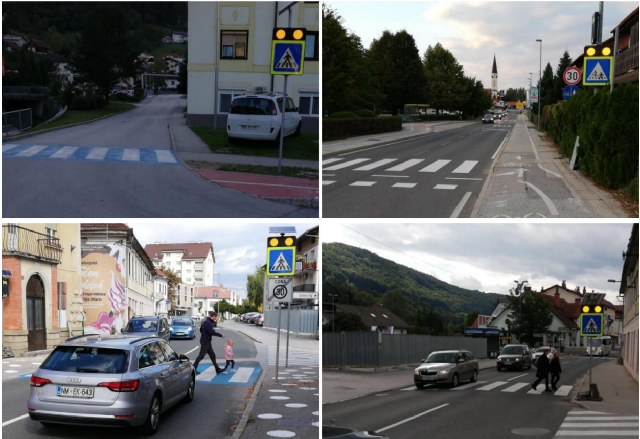
Slika 3: primeri opremljenih prehodov za pešce s sistemom COPS@zebra LITE