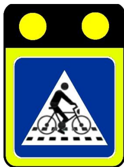
Slika 2: Znak 7205 z vgrajenim stalnim znakom 1115 za prehode za pešce izven naselja

V večini primerov se kot stalni prometni znak uporabi 2431, predvsem v naseljih. Izven naselja se praviloma uporabi znak 1115, ki se postavlja na večji razdalji od prehoda za pešce (150 m do 250 m), da pri praviloma višjih hitrosti prometa voznike pravočasno opozarja na približevanje prehodu.